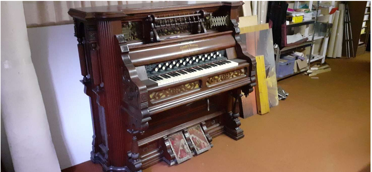
Reed Organ Clough et Warren